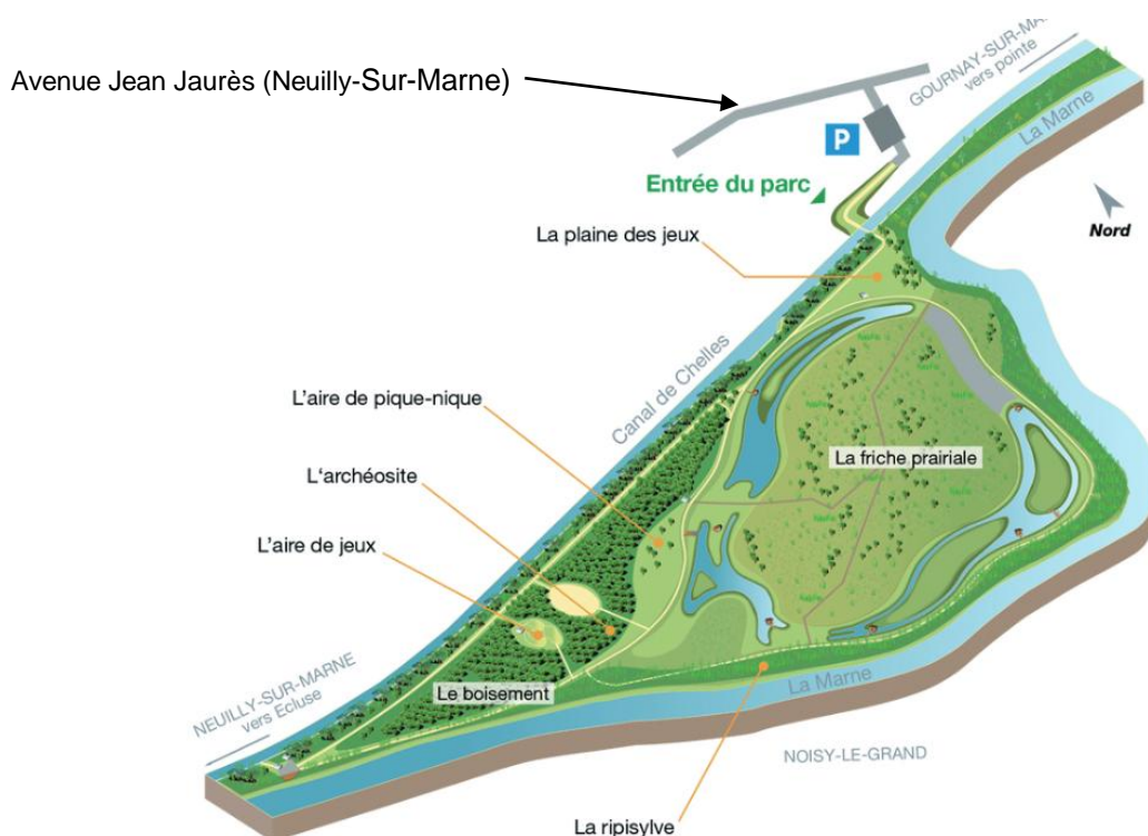
Plan du Parc départemental de la Haute-Île