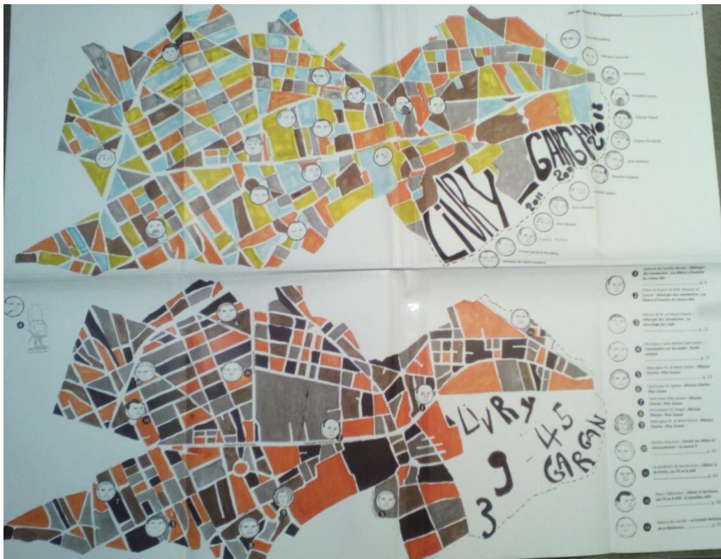
Carte de Livry-Gargan : 1939-1945 : Lieux de résistance 2018 : Noms des rues sur les figures de la résistance et de la Libération

Projet 2017-2018 : Sujet : « S'engager pour libérer la France » Angle choisi : Libérer Livry-Gargan et la France : 66 destins à travers les rues de la ville Document présenté : Couverture / Table des matières