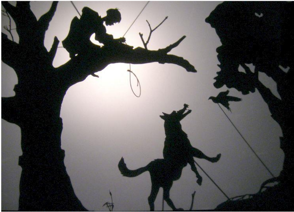
Théâtre d'ombres - Pierre et le loup, Théâtre des ombres