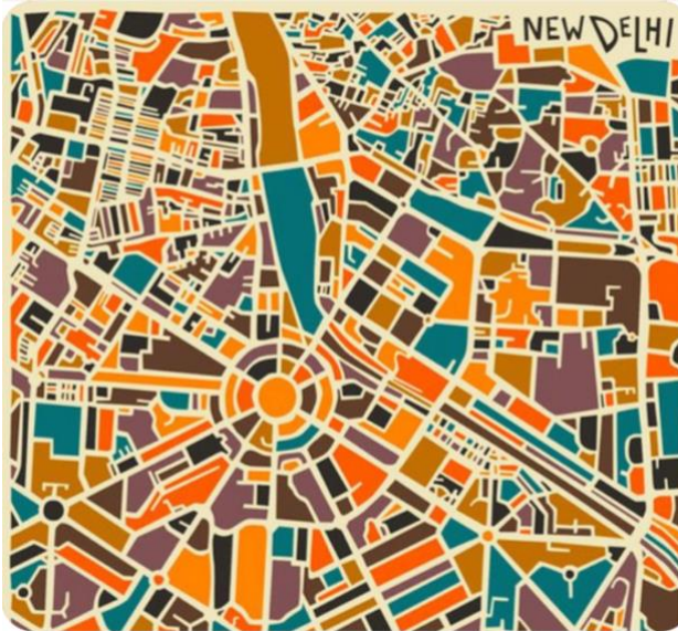
New Delhi – Jazzberry Blue