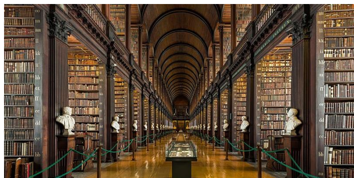
Bibliothèque du Trinity College, Dublin.

Harry Potter et l'ordre du phénix , Chapitre 29