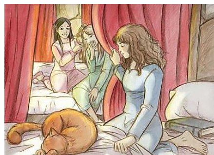
Marta T. Art Dungeon