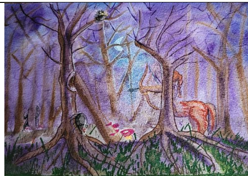
Auteure : N. Jouvét

Harry Potter à l'école des sorciers, Chapitre 15