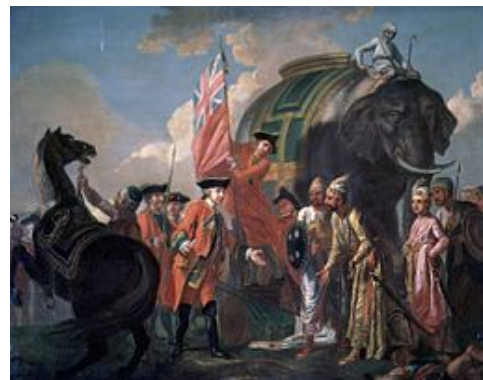
Doc. 2 : la bataille de Plassey (1757). Cette bataille, livrée dans la région du Bengale, fut une défaite pour les Français. Elle marqua le début de la domination britannique en Inde.

D'après une lettre des dirigeants de la Chambre de commerce de Bordeaux au ministre des Affaires étrangères, décembre 1761.