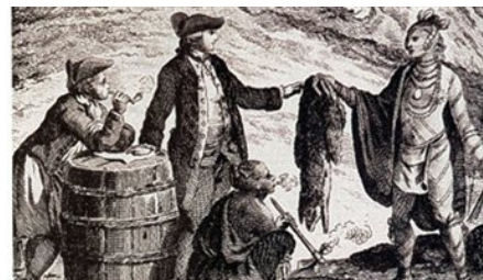
Doc. 5 : le commerce des fourrures avec les Indiens.

Tableau d'Hervey Smyth, 1797. Library of the Canadian Department of national defense.