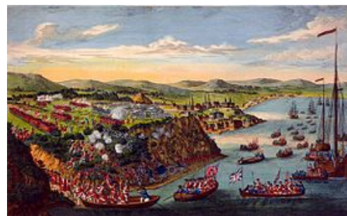
Doc. 3 : la prise de Québec, colonie française, par les Anglais en 1759.

Rencontre entre Lord Clive et Mir Jafar après la bataille de Plassey, par Francis Hayman (c. 1762)