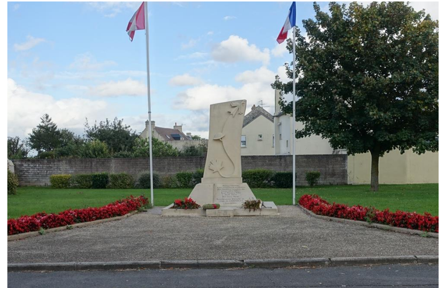
Mémorial Canadien inauguré en 2004 à Carpiquet (Calvados)