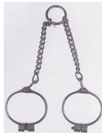
Doc. 6: Entrave en fer . Utilisée pour la traite des Noirs, elle porte la marque DAC (Da Costa) fabricant des chaînes et instruments de traite à Nantes au XVIIIe siècle.